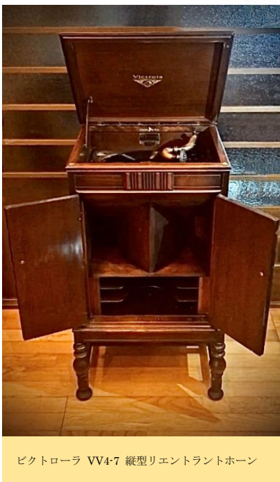
ビクトローラ VV4-7 織型リエントラントホーン