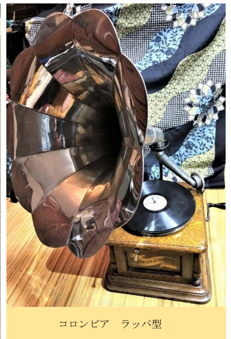
コロムビア ラッパ型